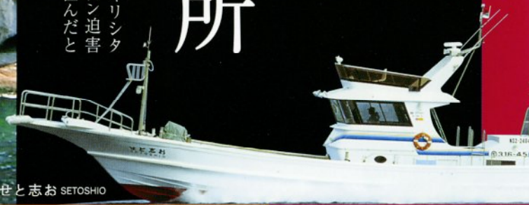
〈旅館 前川荘 遊漁船〉せと志お SETOSHIO

旅館 前川荘《ギリシタン洞窟・瀬渡ししとご案内》 おとな お一人様・・・5,000円(税込) お二人様以上から一名様・・・3,000円(税込)